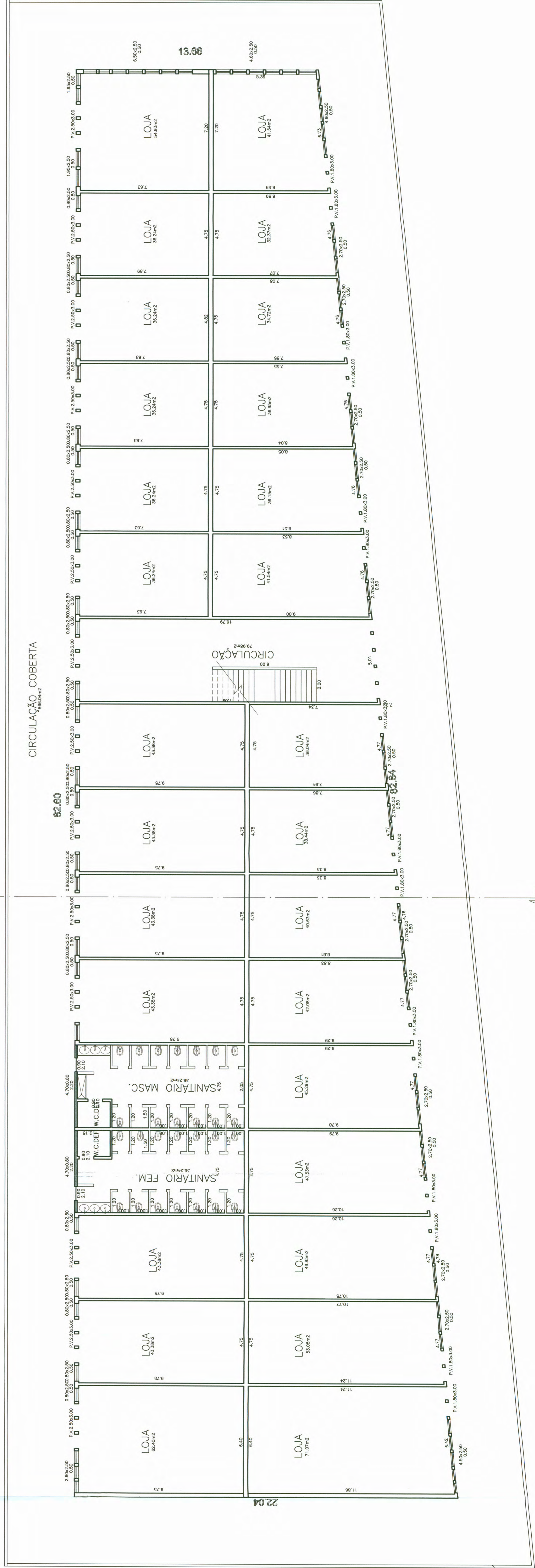
RUA MORAES DE BARROS