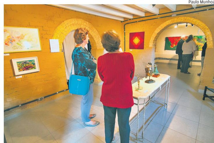
Ateliê São Nicolau de Mira durante evento no ano passado

Stefanie Archilli stefanie@pjournal.com.br